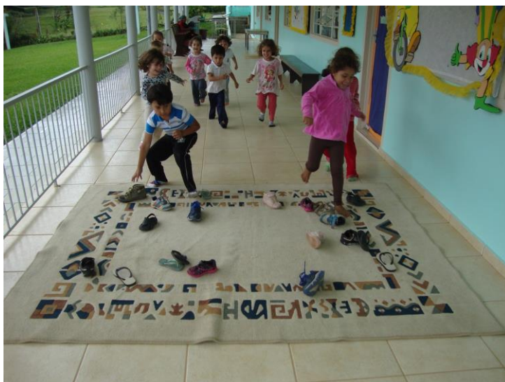
Corrida do sapato - brincadeira para aprender a contar de 2 em 2.

Para os alunos aprenderem que os números também podem ser contados de 2 em 2, vamos realizar essa brincadeira em duas etapas.