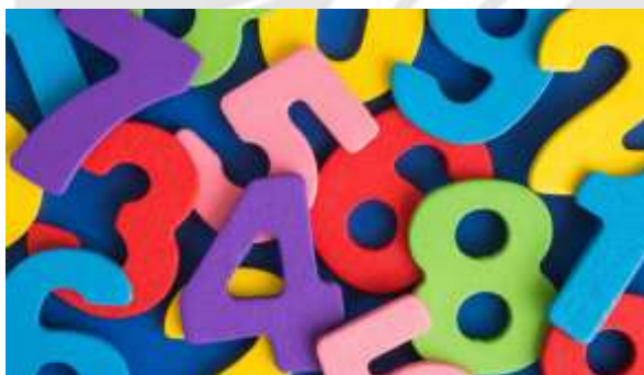
Números coloridos para contar a estória.

E foi assim, com muitas emoções e grandes descobertas que terminou mais 1 brincadeira de Joana e seus amigos, ou melhor, dos números 1, 2, 3 e 4.