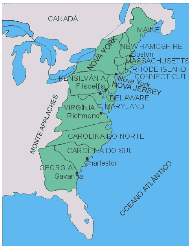
Mapa das 13 colônias

Em seguida, reproduza o mapa do período colonial: