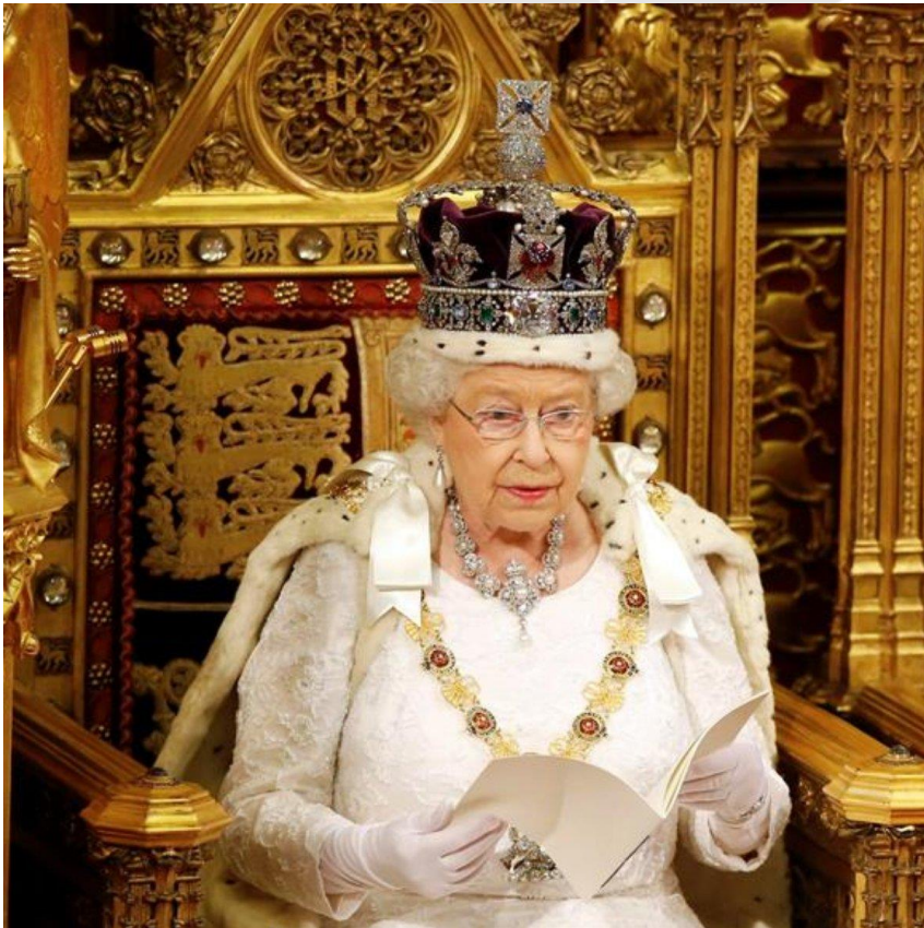
Rainha Elizabeth II

[caption id="attachment_83864" align="aligncenter" width="500"]